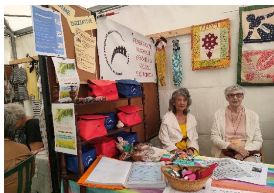
Foto stand Sinodo 2025

Saremo presenti con lo stand, presso il quale vi invitiamo a passare! Vi aspettiamo!